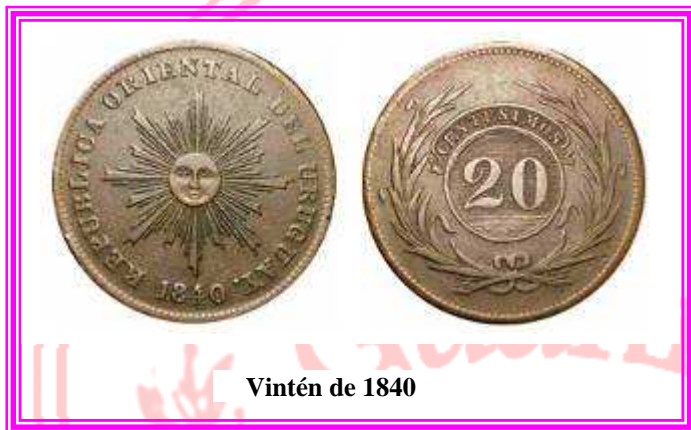
Vintén de 1840