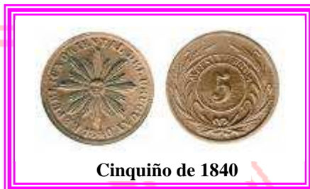
Cinquino de 1840

A principios de 1838, ocupaba la presidencia de la República el Presidente del Senado, don Gabriel Antonio Pereira, pues el titular del Poder Ejecutivo, el General Fructuoso Rivera, se encontraba en campaña al frente del ejército; eran los comienzos de la Guerra Grande.